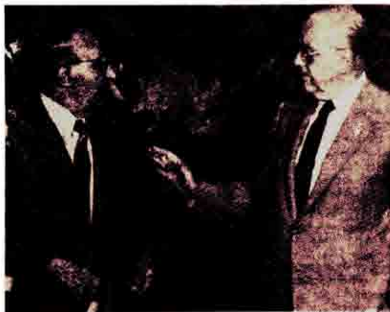
Παπανδρέου με τον Ζίβκοφ λίγο πριν αρχίσει η κοινή συνέντευξη

Η παλιά Δεξιά, παρά τις όποιες «φιλελευθεροποιήσεις» της και τους «πατριωτισμούς» της δεν μπορεί να κρίνει τον αντιδραστικό της χαρακτήρα. Έτσι όπως την γνώρισε ο λαός μας από παλιά, γεμάτη εθνικές προδοσίες και ξεπουλήματα, υπηρέτη της αμερικανικής υπερέδναμης. Ο Μητσοτάκης συνεχίζει την ίδια παράδοση. Η δε δξινση του ανταγωνισμού των υπερέδναμων στη χώρα, τον αναγκάζει όλο και πιο πολύ να συμπορεύεται με τον τουρκικό επεχτατισμό. Οι «διαβεβαιώσεις» του πως η στρατοκρατική κλίκα της Άγκυρας δεν έχει επεχτατικές βλέψεις σε βάρος οποιασδήποτε περιοχής περιλαμβανομένης και της Κύπρου» δείχνουν τον ρόλο του.