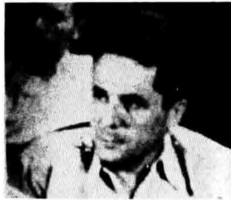
«...όσο για την πολιτική του δύο πόλων αποτελούσε και αποτελεί μια ρεαλιστική δημοκρατική εξωτερική ελληνική πολιτική στις μεταπολεμικές συνθήκες και συγκεκριμένη περίοδο ανάπτυξης του λαϊκού κινήματος της χώρας μας.»

Σήμερα που προβάλλεται παντού η πολιτική της συνύπαρξης και που όλα σχεδόν τα κομμουνιστικά κόμματα στις καπιταλιστικές χώρες πήραν τη θέση της υποστήριξης της ουδετερότητας για τη χώρα τους και της φιλίας και της συνεργασίας με όλους (βλέπετε λ.χ. και έκθεση Τολιάτι στην ευρεία ολομέλεια της ΚΕ και ΚΕΕ του ΚΚ Ιταλίας του Οχτώβρη 1961) μια τέτοια επίθεση σαν της φραξιονιστικής κλίμας απέναντι στους