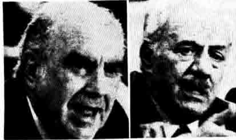
ΠΑΠΑΝΔΡΕΟΥ - ΦΛΟΡΑΚΗΣ Η κρυφή σύμμαχος της νέας δεξιάς

Τι σημαίνει αυτό; Σημαίνει ότι συζητάμε με το ΠΑΣΟΚ και όχι με την φράξια Κουτσουρωτή - Γιαννιπούλου. Και αυτό από δύο πλευρές: τόσο για το χτύπημα αυτής της φράξιας που μέσα από τον σωβινισμό της έχει το λιγότερο φιλορωσικά και πιο αντι-ΚΚΕξ, χαρακτήριστικά, όσο και για το φρόνημα όλης της ανταγωνιστικής πολιτικής του Παπανδρέου σ' αυτούς και το κέρδη των εργαζόμενων στο φιλορωσικό μπλοκ. Είναι αυτό που